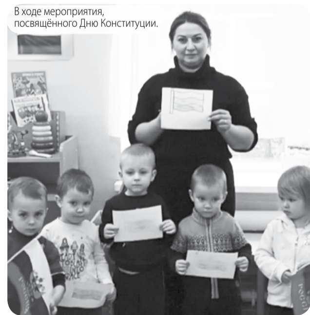
В ходе мероприятия, посвящённого Дню Конституции.

В ходе подобных мероприятий дети закрепляют и уточняют представления об Основном законе нашей Родины, правах и обязанностях граждан России.