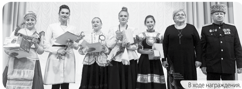
В ходе награждения.

На сцене ЦДТ «Предгорье» прошел VIII традиционный конкурс девочек-казачек «Краса казачья-2022» ежегодно проводимый Центром казачьей культуры Предгорного округа.