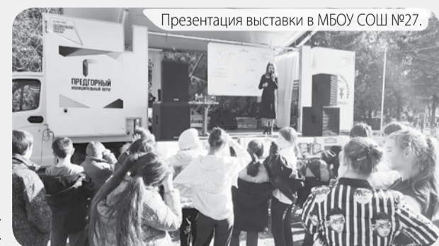
Презентация выставки в МБОУ СОШ №27.

Как подчеркивают организаторы, цель экспозиции - отдать дань уважения меккам, стоящим на страже здоровья людей как в военные, так и в мирные годы, познакомить широкую аудиторию с традициями милосердия в семье Льва Толстого.