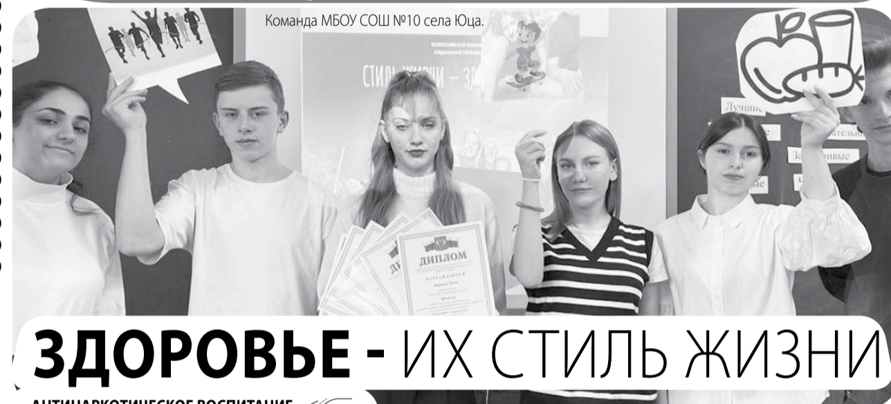
Команда МБОУ СОШ №10 села Юца.